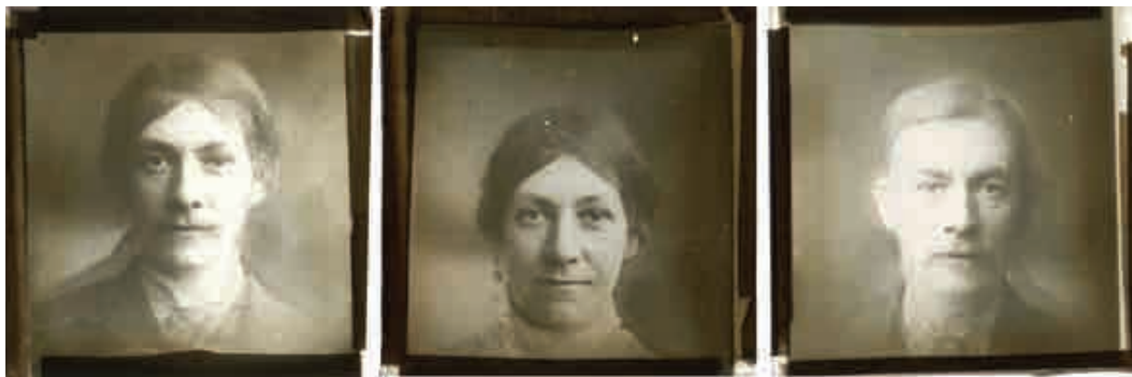
تصویر ۷. از مجموعه تهیه شده توسط فرانسیس گالتن از زندان میل بانک