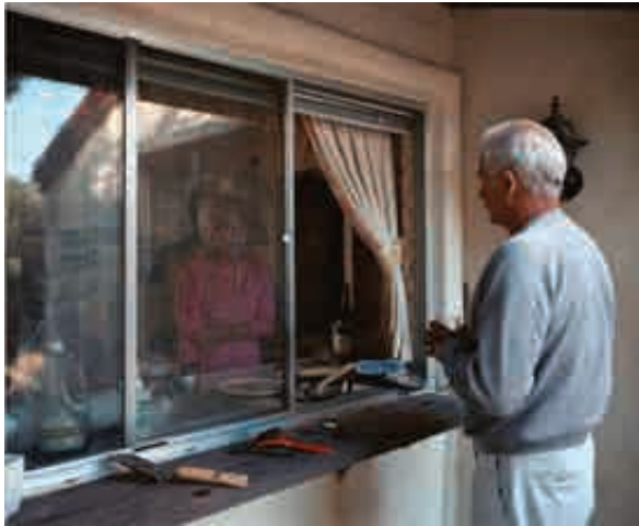
تصویر ۳. گفت‌وگویی از آن طرف پنجره آشپزخانه، ۱۹۸۶

صورت که عرضه انکاره‌های عکاسانه (بدون مداخله عکاس) از طریق عکس‌ها غیرممکن می‌نماید. از این منظر سوپرکتیویته نیز به همین گونه دچار تفاوت می‌شود و آن وابستگی بی‌چون و چرای آن به تفسیری است که متأثر از تجربه بشری است و در واقع گونه‌ای فردی‌تر از یک ابژه کلی‌تر را می‌نمایاند.