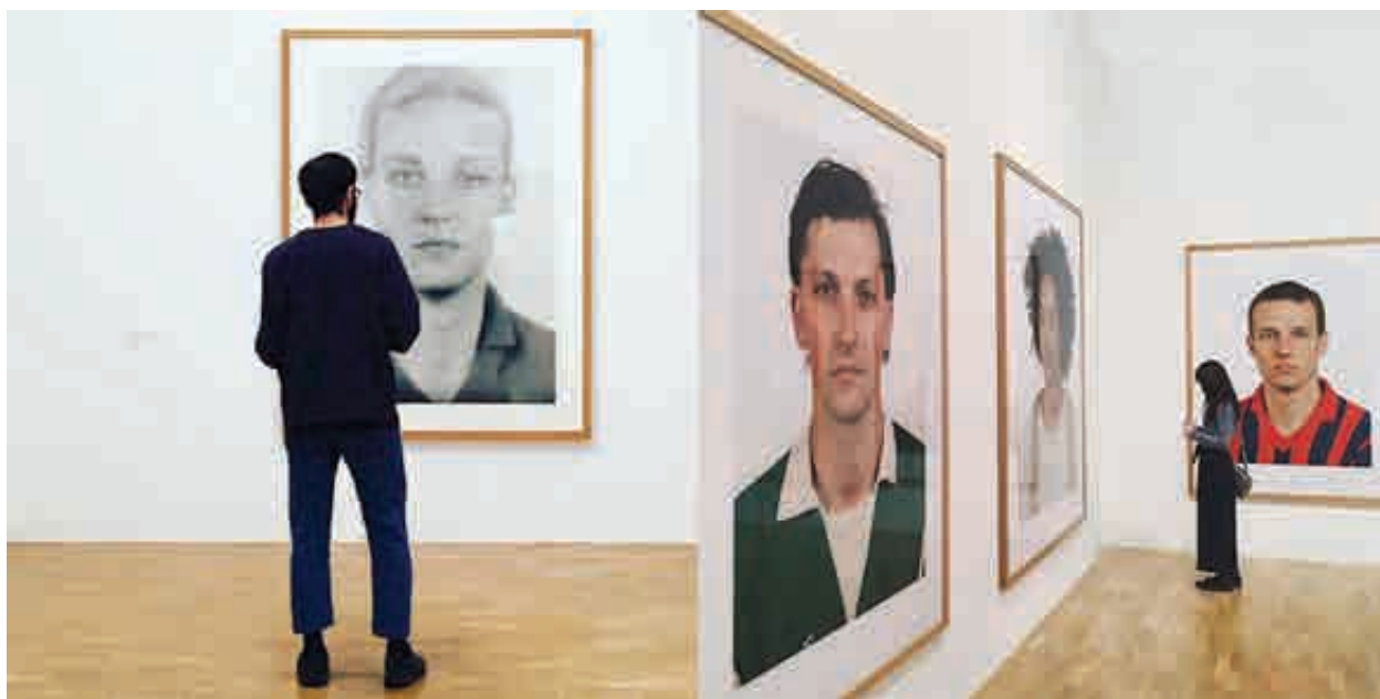
تصویر ۸. بخشی از نمایشگاه پرتره‌های توماس راف

قرار می‌دهند که پس از ۱۹۶۰ این گونه عکاسی موجبات ظهور گونه‌ای از هنرمندان را مهیا ساخت که در اصطلاح «هنرمندان به کاربرنده عکاسی» نام گذاری شدند و هنر به طور فزاینده‌ای عکاسانه شد. (campany, 2003: 132)