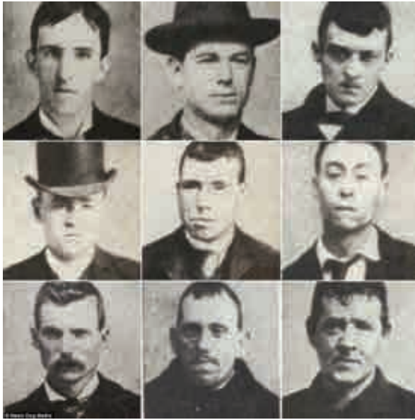
تصویر ۶. نمونه‌ای از چهره‌نگاری‌های ابتدایی

شگرفی از شرایط غرب قرن ۱۹ را به ما می‌رساند. آلن سکولا ۱۲ نظریه پرداز شهیر عکاسی بر این باور است که چهره‌نگاری‌های جنایتکاران بر پیامدهای اندیشه‌های در حال شکل‌گیری در زمینه‌های چهره‌شناسی و جامعه‌شناسی و حتی مفاهیم و پروژه‌های اصلاح نژادی نیز تأثیر گذار بوده است (Sekulla, 1989: 130). (تصویر ۶) یکی از مهم‌ترین این فعالیت‌ها در زمینه اصلاح نژادی که به کار بست چهره‌نگاری‌های عکاسانه انجامید و مفاهیم پرتره‌نگاری را وارد فضایی تازه از زمینه‌های تی و ریک نقد و تفسیر کرد، مجموعه فعالیت‌های پژوهش