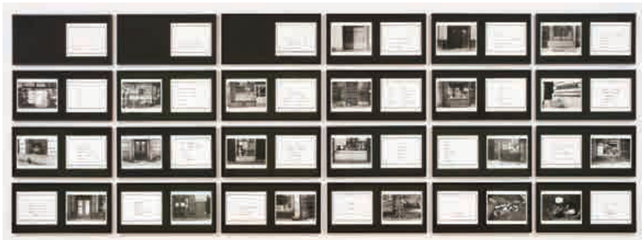
تصویر ۴. از مجموعهٔ مارتا روسلر، منطقهٔ باوری در دو نظام توصیفی نابسند

در نیویورک را نشان می‌دهد و این در حالی است که در هیچ‌یک از این تصاویر اثری از فرد قربانی دیده نمی‌شود و تنها به ذکر اصطلاحاتی عامیانه از شرایط زندگی آن منطقه پرداخته می‌شود (تصویر ۴).