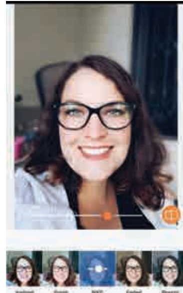
تصویر ۵. از مجموعه عکس‌های دستکاری شده اینستاگرام

یعنی پرتره‌نگاری‌های اینستاگرامی ادامه حیات یافت (تصویر ۵). این گونه پرتره‌نگاری‌ها امروزه بخشی از پایگاه اطلاع‌رسانی تصویری در فضای مجازی به حساب می‌آیند که توسط هر فرد تشکیل شده است و این امر گاهی به حدی فراگیر شد که مناقشات فراوانی بر سر امکان دسترسی همگان به تصاویر یکدیگر را فراهم آورد (Eving, 2006: 10-12). اما پرتره‌نگاری و هویت نقادانه آن صرفاً دنیای امروز را شامل نمی‌شود بلکه مهم‌ترین تصاویر چهره موجود در جهان به عکس‌های پلیس قرن ۱۹ می‌رسد و تصاویری را تولید می‌کند که اطلاعات