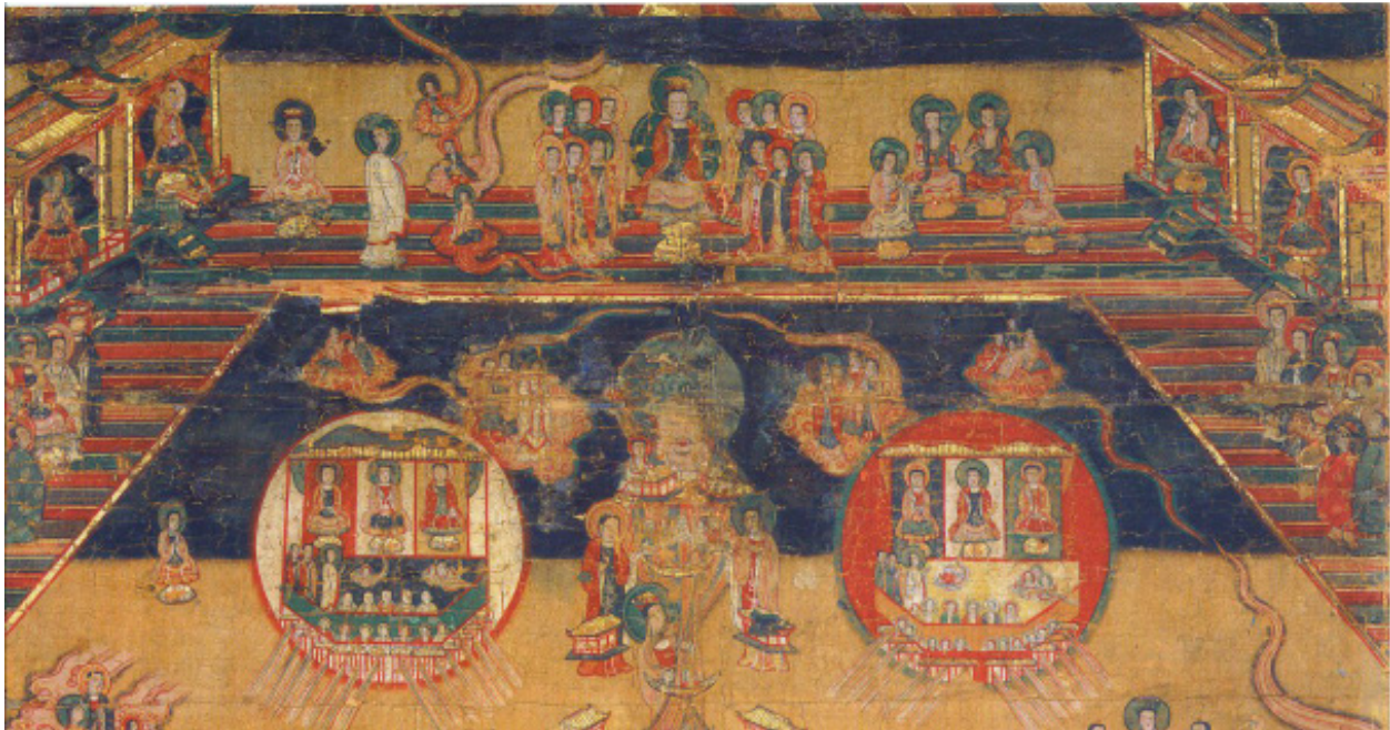
تصویر ۴. ائون نو و رهاسازی نور، یعنی سه‌گانه خورشید، ماه و چهره آسمانی سوم در میان آن‌ها (Yoshida/ Furukawa: 2015: plate 5). در بهشت روشنی/ ائون نو پدران بر تختگاه خود جلوس کرده‌اند تا زمانی که خدای متعال (شهریار بهشت، پدر بزرگی)، تصویرش را در فرجام جهان نمایان کند (کفالایا ۳۹: ۷-۲، ص ۱۰۳).

مانوی، هاله‌هایی در اطراف سر افراد به تصویر کشیده شده‌اند که گاه در اطراف ایزدان مانوی و حتی ائون‌ها نیز دیده می‌شود. (Gulácsi, 2005: 27-29) این هاله‌ها به‌عنوان نمادی از نور و روشنایی در هنر مانوی به کار گرفته شده‌اند و ارتباط مستقیمی با باورهای مانوی درباره نور به‌عنوان جوهر الهی و مقدس دارند. در مواردی، این هاله‌های نور با استفاده از طلا تزئین شده‌اند، که نشان‌دهنده تلاش هنرمندان مانوی برای القای شکوه و معنویت شخصیت‌های