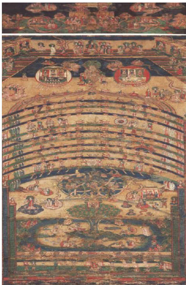
تصویر ۱. نمودار کیهانی (Gulácsi 2016, Figure 5/14 [p. 248]).

این بازسازی، گبور گُشه در سال ۲۰۱۶ مقاله‌ای را منتشر کرد تا از این طریق قسمت‌های زیرین نمودار کیهانی را مورد بررسی و «بهشت نو» مانوی را از لحاظ متن و تصویر مورد تحلیل قرار دهد (Kósa 2016a, 27–113). (تصویر ۱)