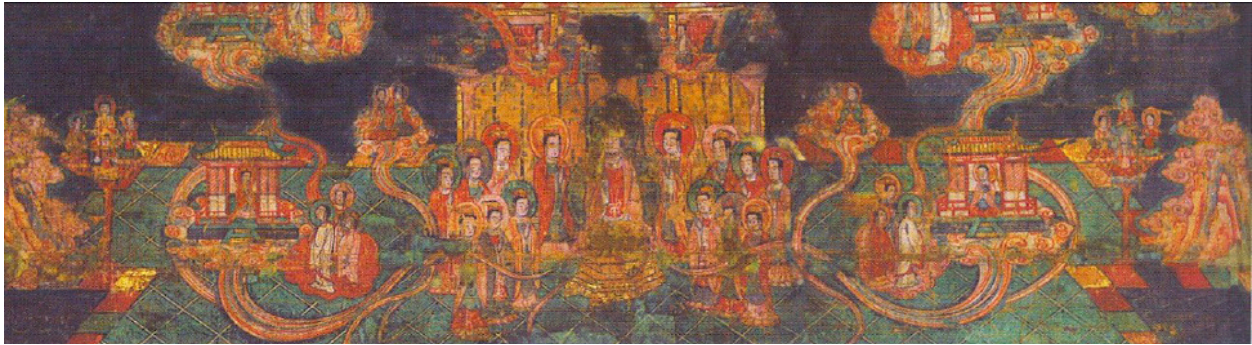
تصویر ۳. قلمرو روشنی (The Realm of Light (Gulácsi 2016, Figure 6/37 [p. 446])

بزرگی» بهشت روشنی ارائه می‌شود که آن را نخستین بار هنینگ در سال ۱۹۴۸ منتشر کرده است. این متن سپس مورد تحلیل‌های مفید و روشنگرانهٔ قریب در دو مقالهٔ منتشرشده در سال‌های ۱۳۷۶ و ۲۰۰۰ قرار گرفته است (HENNING 1948; GHARIB 2000) و قریب ۱۳۷۶؛ قریب ۱۳۸۳- ب). در این توصیف، ویژگی‌ها و ابعاد مختلف بهشت روشنی و اهمیت آن در نظام اعتقادی مانوی به گونه‌ای عمیق و پیچیده بررسی شده است. «پنج بزرگی» به معنای الهیات و نظام معنوی این بهشت، نشان‌دهندهٔ ساختار کیهانی و روابط موجود میان فرشتگان و انسانی است که در جست‌وجوی رهایی و نور هستند. به‌جز اهمیت این متون در ارائهٔ روشنی‌های بیشتری بر کیهان‌شناسی مانوی، شایان ذکر است که تحلیل‌های صورت‌گرفته از سوی هنینگ و قریب می‌تواند به درک ما